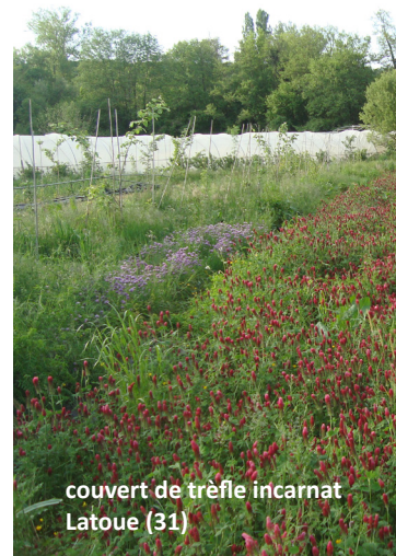
couvert de trèfle incarnat Latoue (31)

Nous vous invitons à vous inscrire dans les délais pour permettre une bonne organisation.